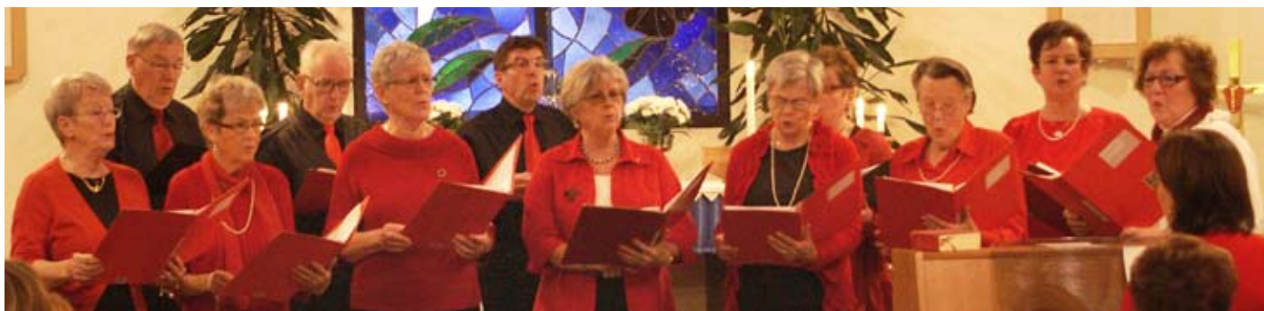
Seniorkören vid "En försmak av julen" 2011.

För skjuts till kyrkan Ring 435 00 mån - fre kl 10-12