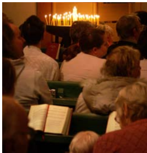
"Tänd ett ljus och låt det brinna - låt aldrig hoppet försvinna!".