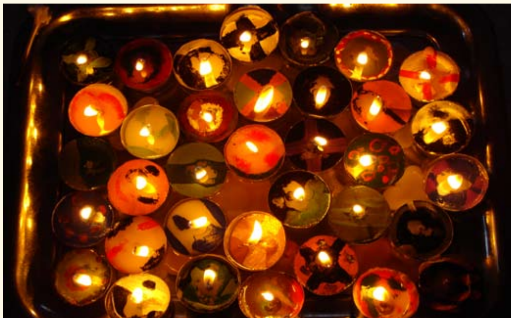
Konfirmandernas Kyndelmässoljus från konfirmandlägret på Hjortsbergagården 9-11 dec. 2011