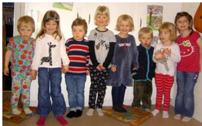
Glädjesångarna m fl medverkar på Fastlagsöndagen.